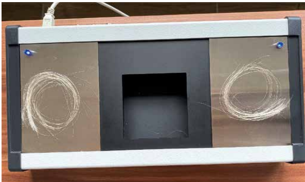
Die Tierhaare, zum Beispiel Mähnenhaare vom Pferd, werden mit dem Bioresonanzgerät in Kontakt gebracht. Das Gerät misst dann ihre Resonanzen zu tausenden verschiedenen Stoffen wie Nahrungsmittel, Schadstoffe, Krankheitserreger etc.