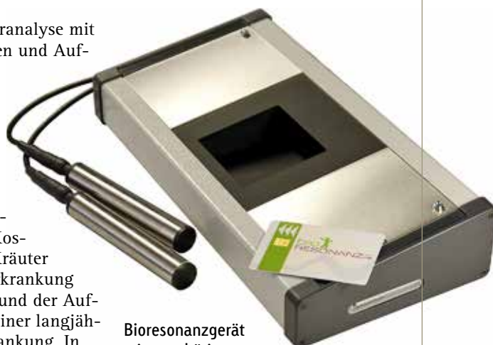
Bioresonanzgerät mit zugehöriger Software.

Man kann nach einigen Monaten eine Kontroll-Haaranalyse machen. Zum Beispiel, wenn noch Restprobleme da sind und man die Therapie anpassen muss bzw. zur Information für den Besitzer, um den Gesund-